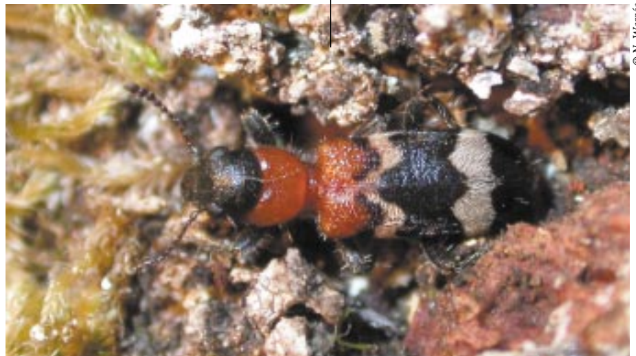
Adulte de T. formicarius (taille réelle : 1 cm).

céas infestés par Ips typographus (et d'autres scolytes) ainsi que des pièges au sol disposés autour de l'arbre. Les résultats obtenus indiquent que les larves de T. formicarius quittent en grand nombre les galeries du typographe pour migrer vers la base de l'arbre, voire quitter définitivement celui-ci.