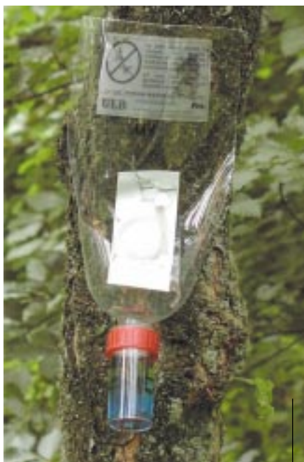
Au-dessus : dispositif expérimental à Wellin. En dessous : piège-bouteille.

vée pour tous les sites. Les rapports prédateur/proies ont également été suivis sur deux ans (2001 et 2002) dans 4 sites (tableau 2). Ces rapports suivent la même tendance que les captures de T. formicarius (sites à dominante pins vs sites à dominante épicéas).