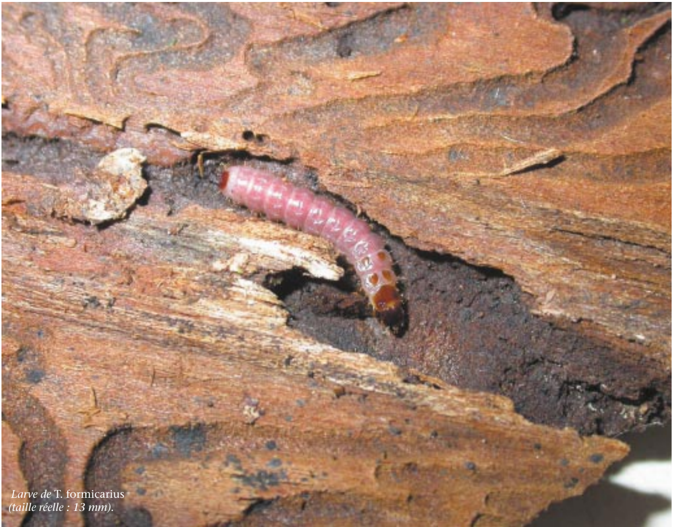
Larve de T. formicarius (taille réelle : 13 mm).

On sait néanmoins que l'insecte est présent en Belgique : il est signalé par LAMEERE dès 1900 10 et se retrouve en abondance dans les collections de l'Institut royal des Sciences naturelles et dans celles de la Faculté universitaire des Sciences agronomiques de Gembloux. En 1997, le prédateur est capturé en assez grand nombre à Chanly, dans une pinède proche de pessières échantillonnées précédemment et où aucun T. formicarius n'avait été capturé. Enfin, un transect de pièges à typographes, mis en place dans une pessière contenant plusieurs îlots de pins 11 , a abouti à la capture du cléride dans un rapport T. formicarius / Ips typographus de 1/650.